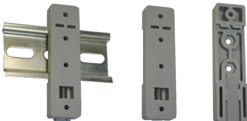
Рисунок 1. Монтажное основание Commeng DR MH

Применяется в качестве дополнительного или основного крепежного элемента для ряда изделий COMMENG .