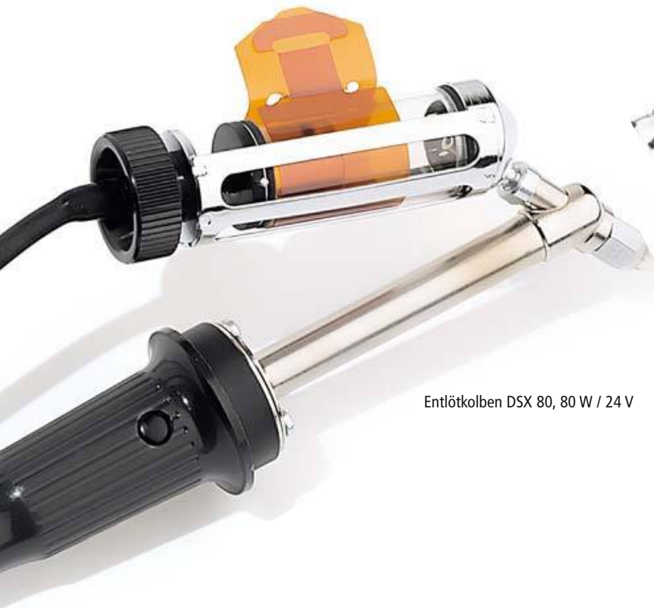
EntlötKolben DSX 80, 80 W / 24 V

Das neu entwickelte, innovative Entlötsystem ermöglicht das Löten, bzw. Entlöten großer SMT-Bauteile bis zu 30 x 30 mm. Das Entlötsystem ist an den zusätzlichen Vakuumkanal (Pick up) der WR 3M anschließbar.